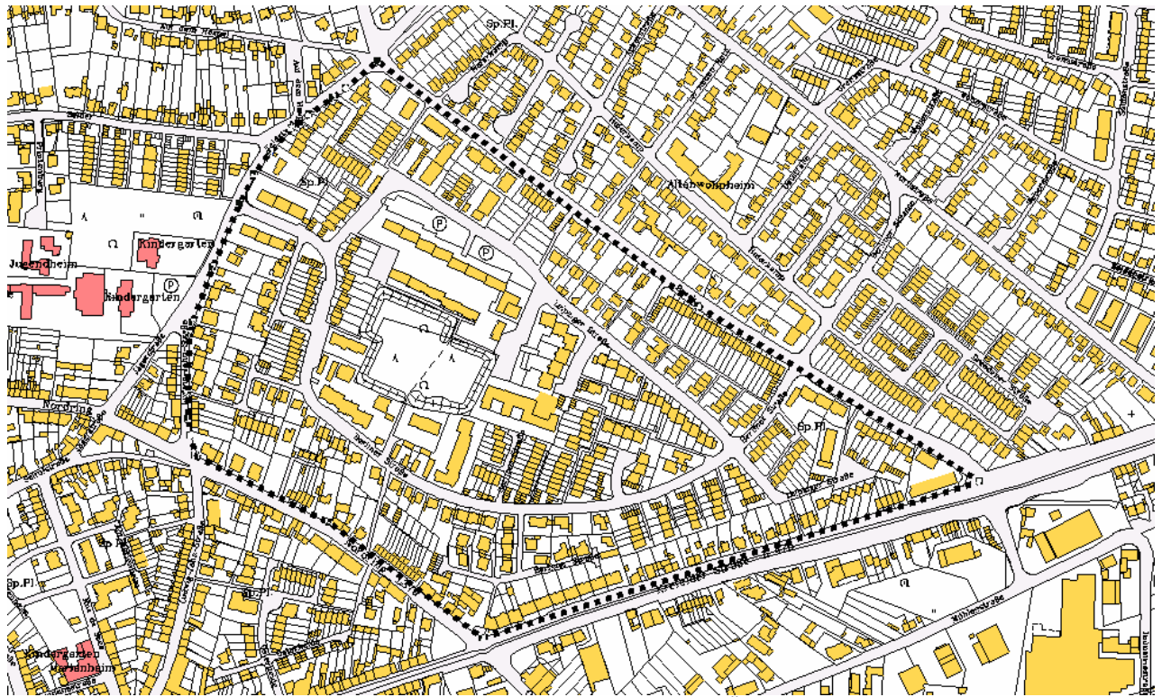
Tö-6a II "Biwak-Süd" 6. vereinfachte Änderung

Der Bebauungsplan Tö-6a II "Biwak-Süd" 6. vereinfachte Änderung tritt mit Ablauf des Erscheinungstages des Tönisvorster Amtsblattes, in dem diese Bekanntmachung veröffentlicht wird, in Kraft.